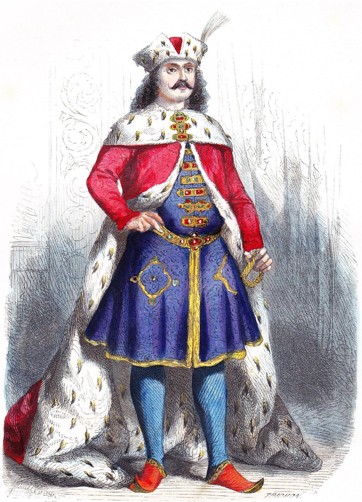
FRANÇOIS RÁKÓCZI II.